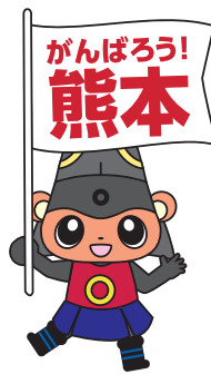
熊本城マラソンマスコットキャラクター「ぎよくま」