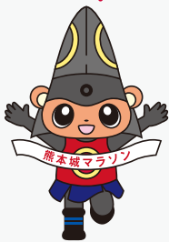
熊本城マラソンマスコットキャラクター「きよくま」

※当日は交通規制が行われ、交通渋滞が予想されます。 ※レース中は歩行者・自転車の横断も制限されます。 ※バスの運休や路線およびダイヤの変更、遅れなどが予想されます。