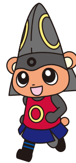
熊本城マラソンマスコットキャラクター“きよくま”